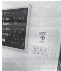
耳マークに筆談ボードも完備

なく、赤ちゃんと一緒にのお母さんや高齢者など、さまざまな人が1つの空間で映画を楽しんでいました。